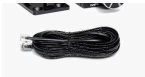
Przewód 5 m